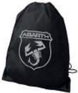
Bolsa promocional Abarth