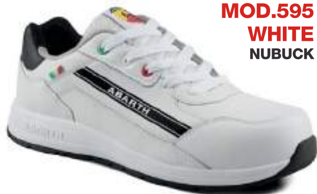
MOD.595 WHITE NUBUCK