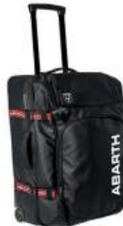
TROLLEY Negro poliester