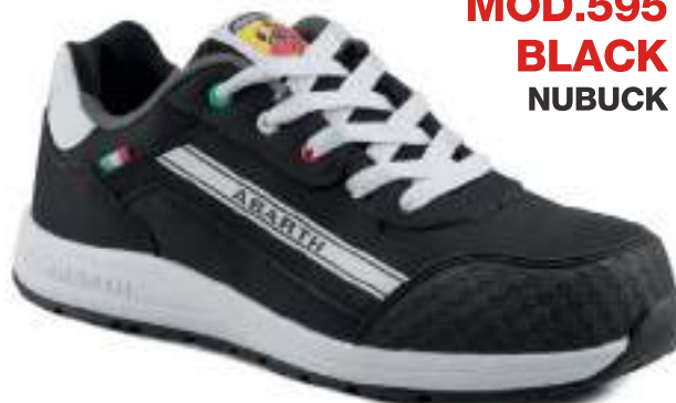
MOD.595 BLACK NUBUCK