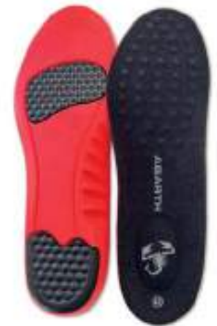
Gel Insole ABARTH +PLUS COMFORT

Tallas 36-39: Ref.ABAC002-36 Tallas 39-42: Ref.ABAC002-39 Tallas 42-45: Ref.ABAC002-42