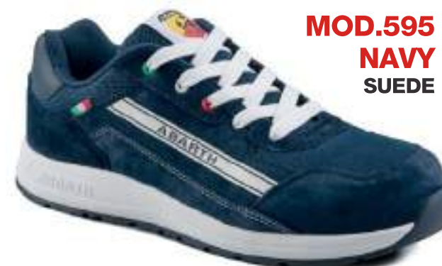
MOD.595 NAVY SUEDE