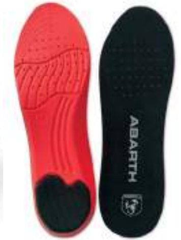
Gel Insole ABARTH Performance

Tallas 36-41: Ref.ABAC001-36 Tallas 42-47: Ref.ABAC001-42