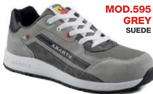
MOD.595 GREY SUEDE