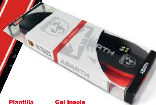
Plantilla de Gel ABARTH Performance