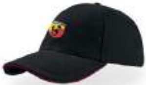
Gorra Promocional Promotional Cap