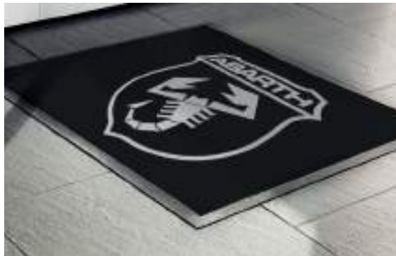
Alfombra Promocional Promotional Carpet