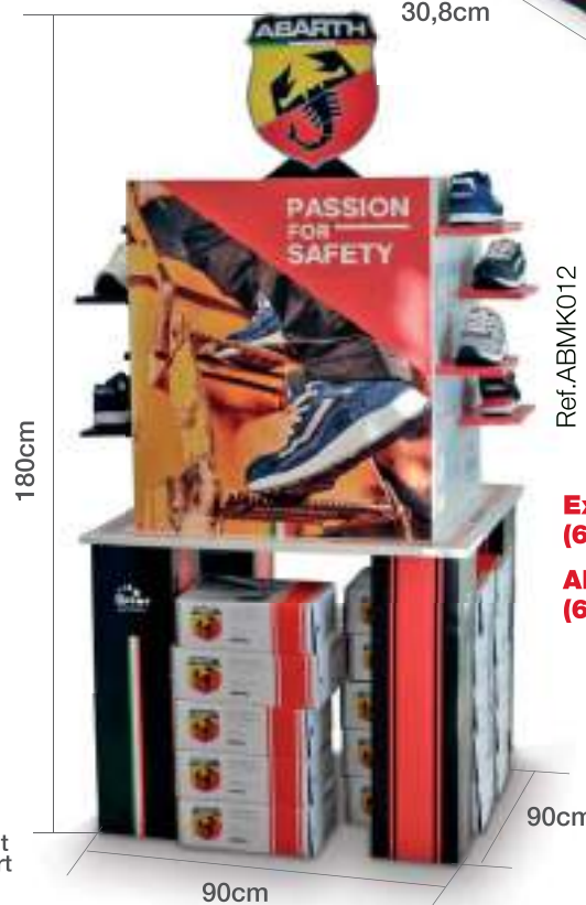
Expositor grande Abarth (60 zapatos) Abarth big display stand (60 shoes)