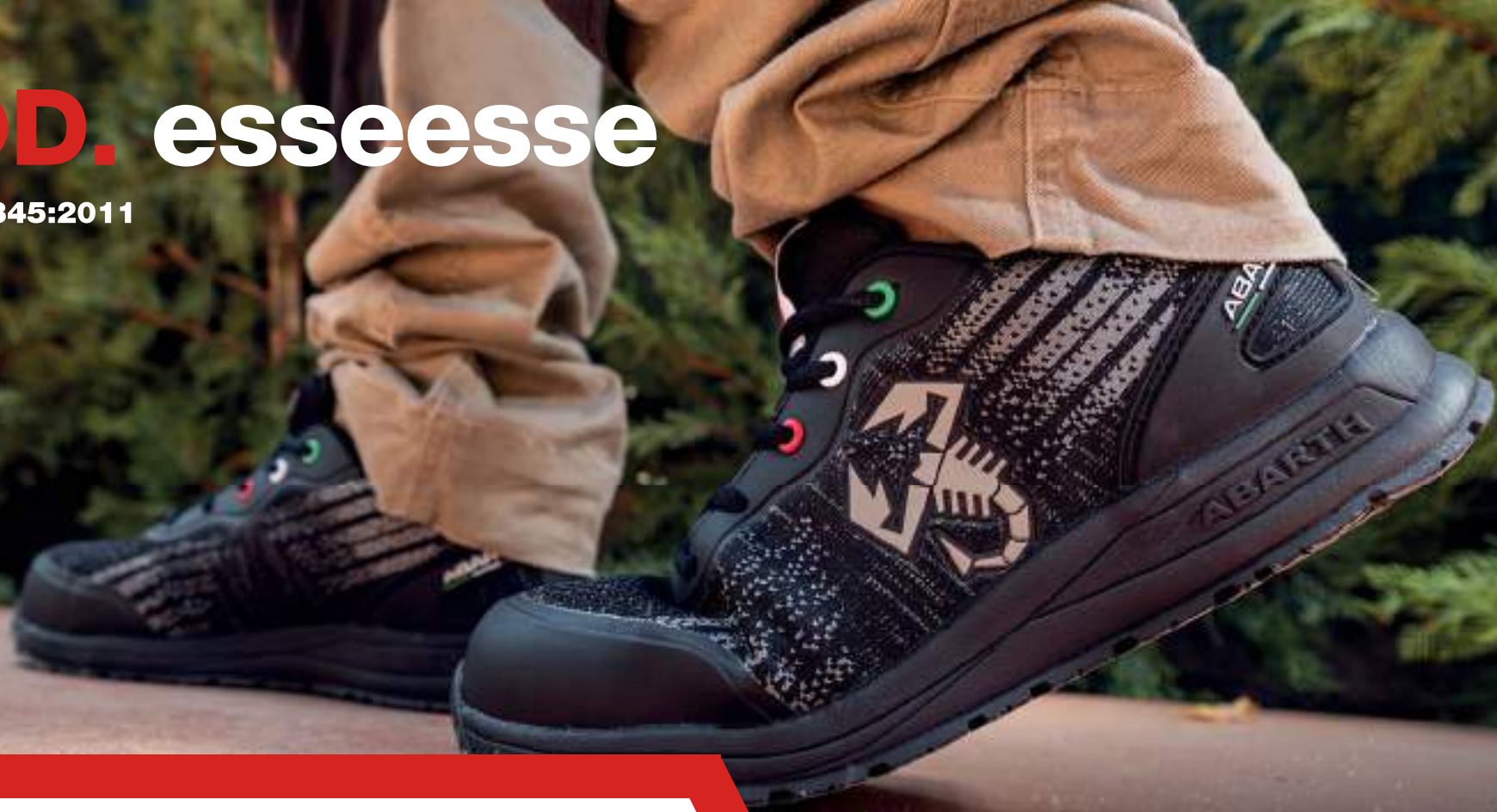
MOD. esseesse BLACK