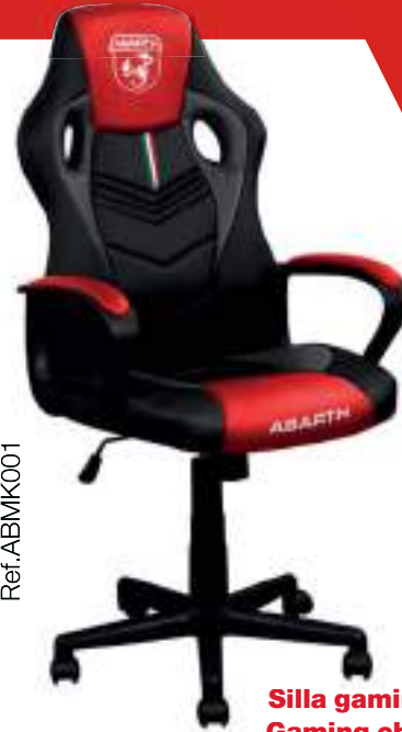
Silla gaming Gaming chair