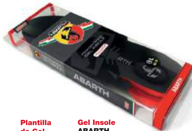
Plantilla de Gel ABARTH +PLUS COMFORT

Tallas 36-41: Ref.ABAC001-36 Tallas 42-47: Ref.ABAC001-42