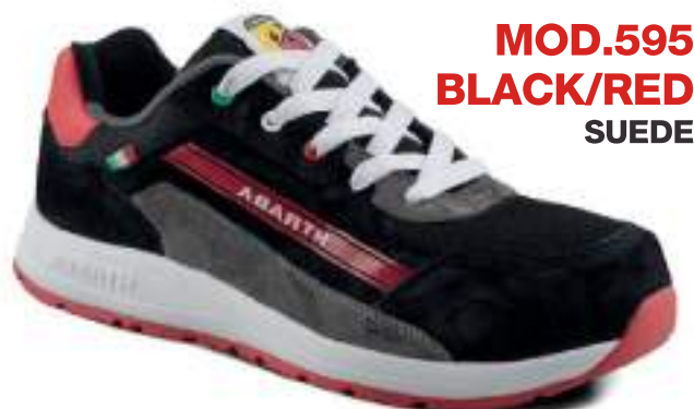
MOD.595 BLACK/RED SUEDE