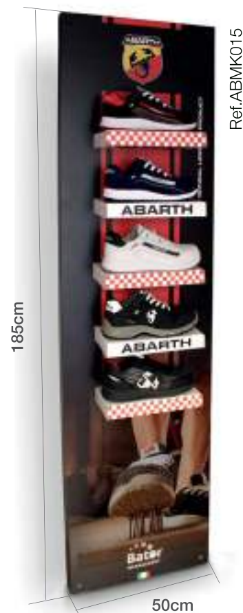
Expositor pared Abarth 5 posiciones Abarth shoes wall display 5 positions 3 posibilidades magnetico, colgante o soporte madera 3 possibilities magnetic, pendant or wooden support