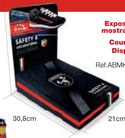
Expositor mostrador Counter Display