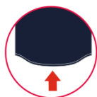
PREFORMA EN BAJOS

» GAMA COMPLETA. Esta prenda forma parte de una amplia colección de prendas con la misma línea de diseño y calidades que ofrecen una solución global.