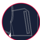
KIESZENIE O NATURALNYM DOSTĘPIE ZAPIĘCIE NA SUWAK BŁYSKAWICZNY