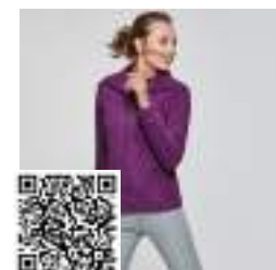
PIRINEO WOMAN CQ1091