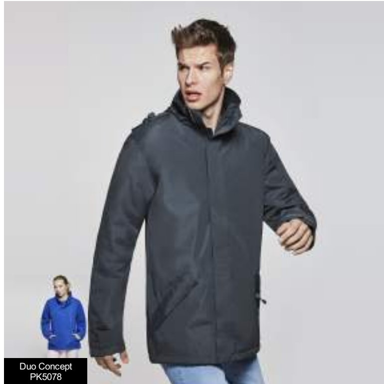
Duo Concept PK5078