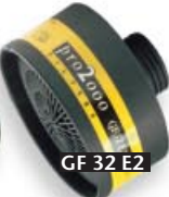
GF 32 E2