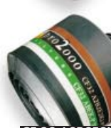
CF 32 A2B2E2K2-P3