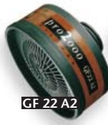
GF 22 A2