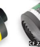
CF 22 K2-P3