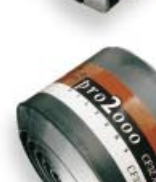
CF 32 AX-P3