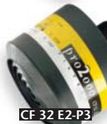
CF 32 E2-P3