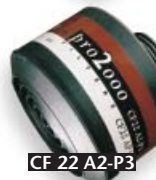
CF 22 A2-P3