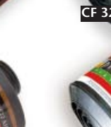
CF 32 A2B2E2K2-Hg-P3