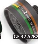
GF 32 A2B2E2K2