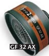
GF 32 AX