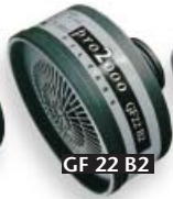
GF 22 B2