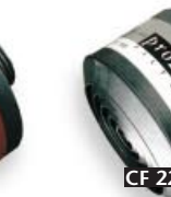
CF 22 B2-P3