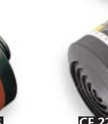
CF 22 A2B2E1-P3