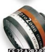
CF 22 A2B2-P3