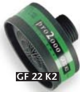
GF 22 K2