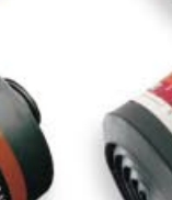
CF 32 Reactor-Hg-P3