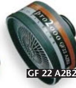
GF 22 A2B2