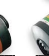
CFR 32 A2B2E2K2-P3