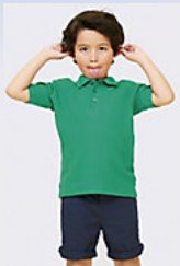
SOL'S SUMMER II KIDS 11344