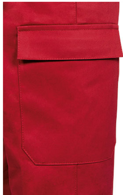
Detalle bolsillo lateral