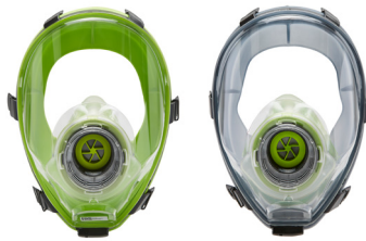
Máscaras completas BLS 5400 - BLS 5150