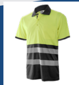
051 Gris/Amarillo AV