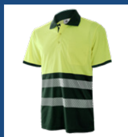
091 Verde oscuro/Amarillo AV