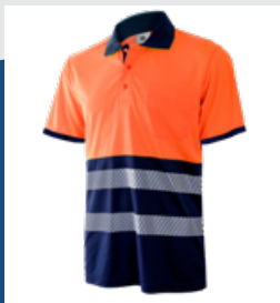
032 Marino/Naranja AV