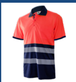
320 Marino/Rojo AV