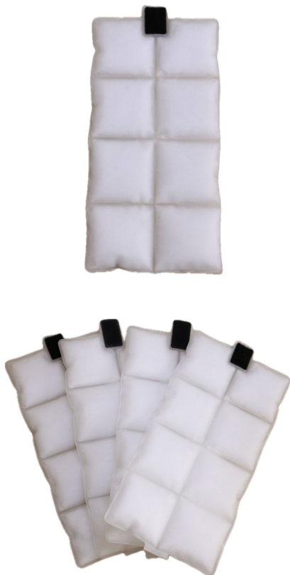
Packs disponibles en 18° y 23°