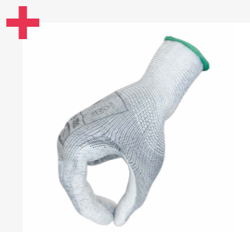
excelente destreza en entornos secos