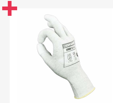
alta precisión, buena destreza