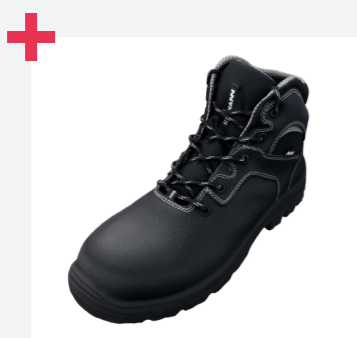
Horma ancha y sistema de doble horma