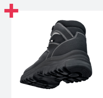
Excelente agarre de la escalera gracias a la certificación LG