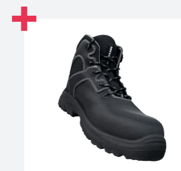
Amplia gama de tallas 35-50