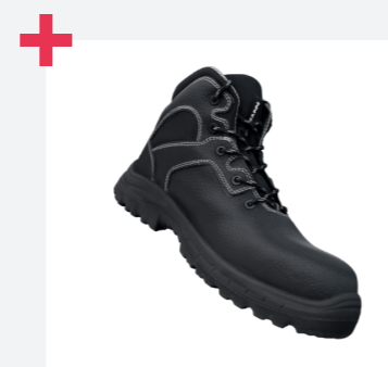
Buena sujeción en la zona del tobillo