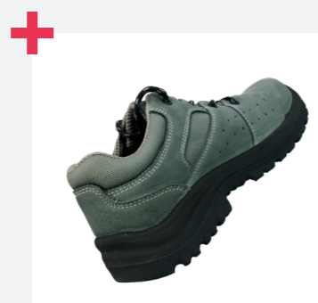
Excelente agarre de la escalera gracias a la certificación LG