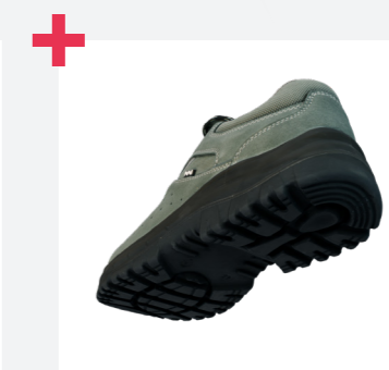
Plantilla confort con tratamiento antibacterias según ISO 16187-2013