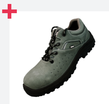
Horma ancha y sistema de doble horma