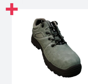
Amplia gama de tallas 35-50