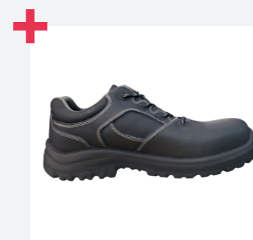
Amplia gama de tallas 35-50