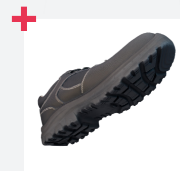
Piel superior con tratamiento hidrófugo