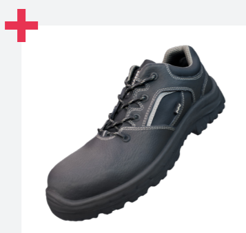
Hormas anchas y sistema de doble horma