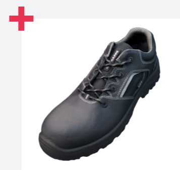
Zapatos robustos y duraderos para cualquier uso intensivo