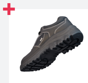
Excelente agarre en escaleras gracias a la certificación LG