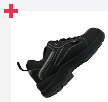
Excelente agarre en escaleras gracias a la certificación LG