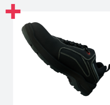
Zapatos robustos y duraderos para cualquier uso intensivo en exteriores