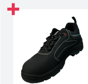
Plantilla con tratamiento antibacterias según ISO 16187-2013