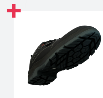
Piel superior con tratamiento hidrófugo