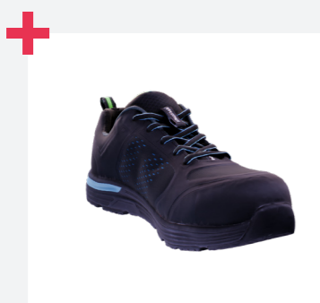
Gran ajuste, sistema de doble horma