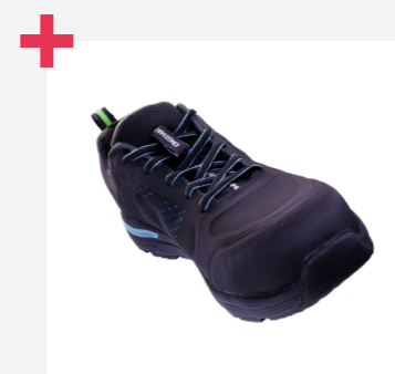
Flexibilidad, parte superior textil de una sola pieza sin costuras