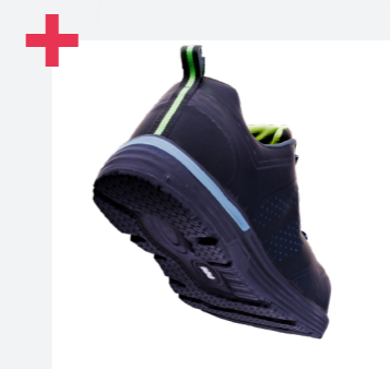
Confort inmediato gracias a la entresuela de Phylon y la plantilla de espuma PU efecto memoria