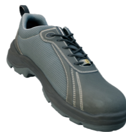
Excelente transpirabilidad gracias a la malla 3D