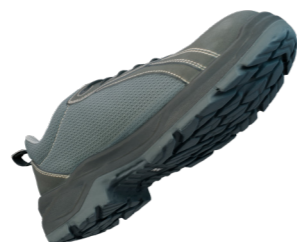
Excelente agarre de la escalera gracias a la certificación LG