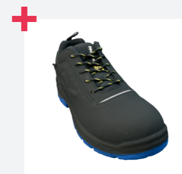
Piel superior con tratamiento hidrófugo