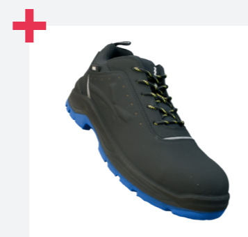
Zapatos robustos y duraderos para cualquier uso intensivo en exteriores