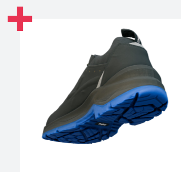
Excelente agarre en escaleras gracias a la certificación LG