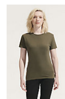
SOL'S REGENT WOMEN 01825